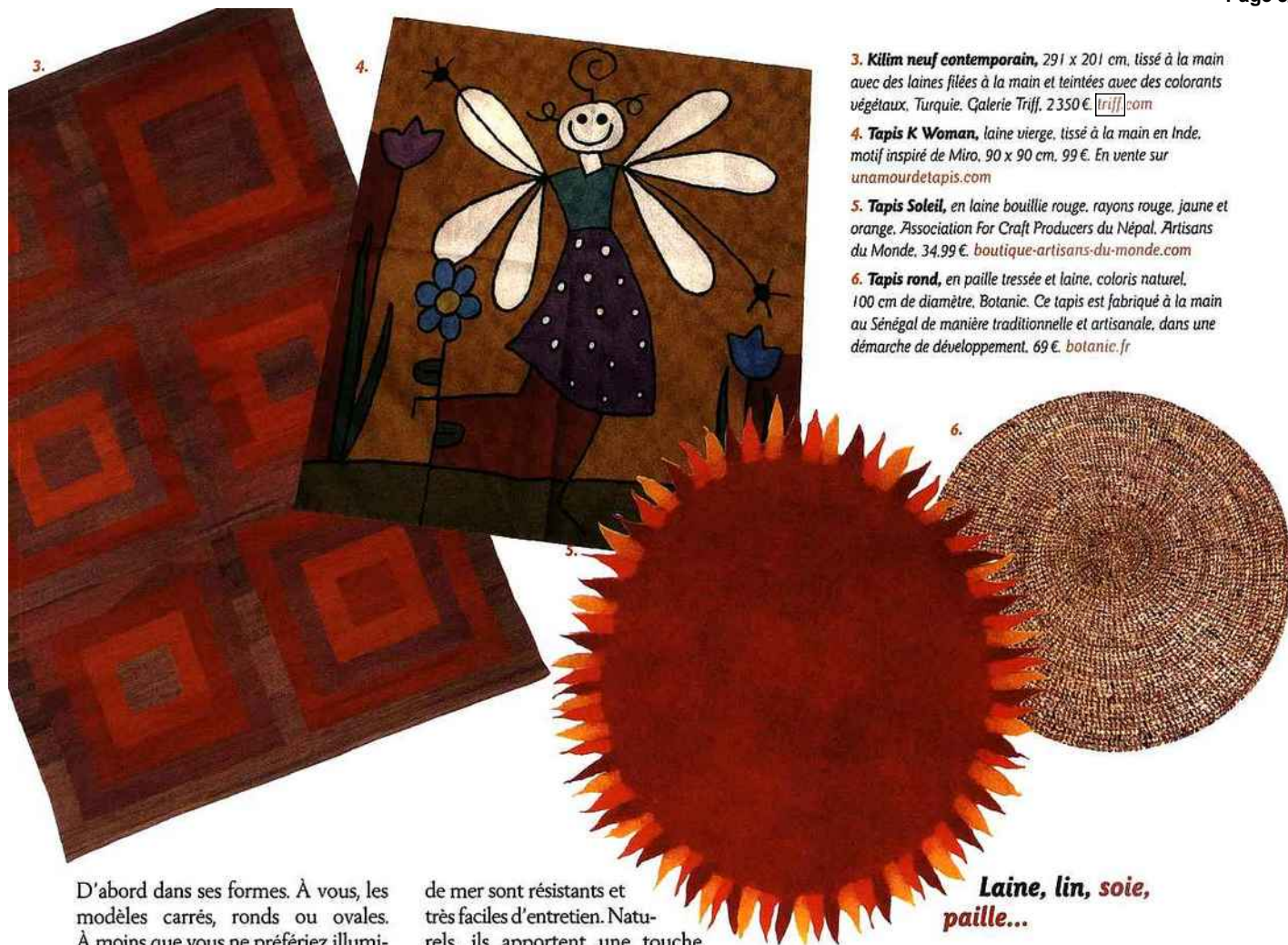
3. Kilim neuf contemporain , 291 x 201 cm, tissé à la main avec des laines filées à la main et teintées avec des colorants végétaux. Turquie. Galerie Triff, 2350 €. triff.com