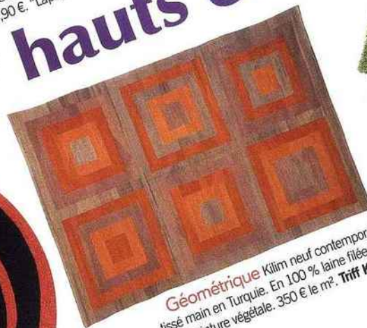
Géométrique Kilim neuf contemporain tissé main en Turquie. En 100 % laine filée à la main, teinture végétale. 350 € le m². Triff Kilim.