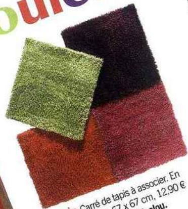
Puzzle Carré de tapis à associer. En velours polyester. 67 x 67 cm, 12,90 € pièce. "Modulo", Saint Maclou.