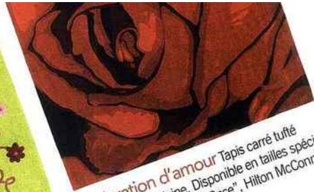
Déclaration d'amour Tapis carré tufté main, en 100 % laine. Disponible en tailles spéciales. 230 x 230 cm, 1 100 €. "Rose", Hilton McConnico pour Toulemonde Bochart.