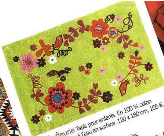
Ronde fleurie Tapis pour enfants. En 100 % coton tufté main. Lavable à l'eau en surface. 120 x 180 cm, 105 €. "Biche", Éveil et Jeux.