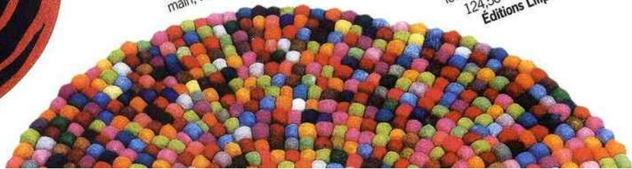
Confettis Grand tapis rond en relief avec boules de laine feutrée multicolore. Ø 80 cm, 124,50 €. "Balls Rug", Éditions Lilipinso & Co.