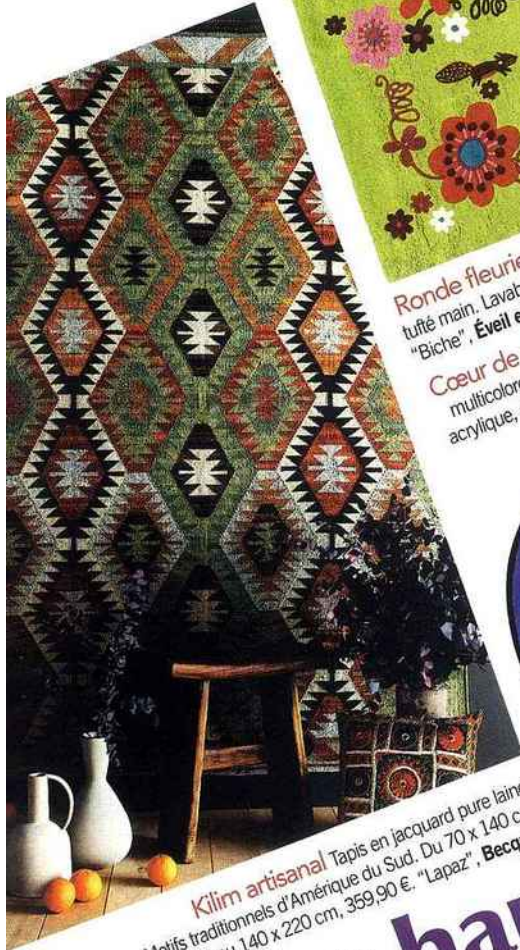
Kilim artisanal Tapis en jacquard pure laine. Motifs traditionnels d'Amérique du Sud. Du 70 x 140 cm, 129,90 € au 140 x 220 cm, 359,90 €. "Lapaz", Becquet.