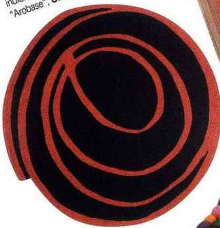
Tourbillon Tapis rond graphique, en acrylique indien. 160 x 160 cm x ép. max 14 mm, 249 €. "Arobase", Un amour de tapis.