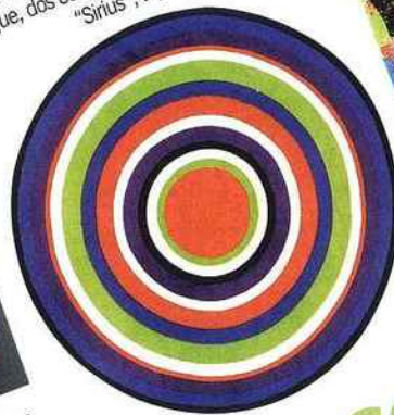
Cœur de cible Tapis rond avec cercles multicolores, tufté mécanique, en 100 % acrylique, dos coton. GM Ø 195 cm, 129 €. "Sirius", Fly.